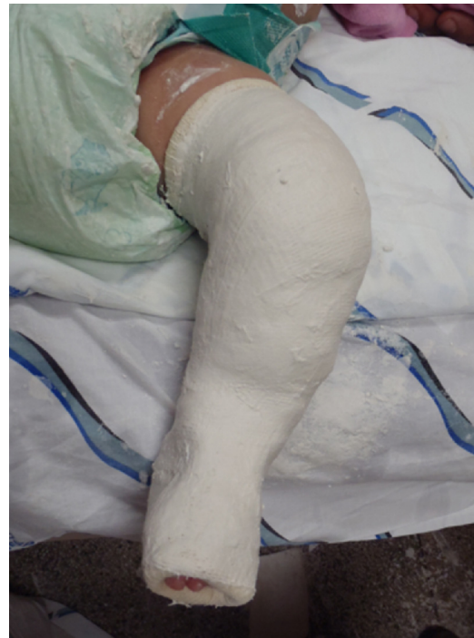
Figura 3 – Gesso cruropodálico que corrige o cavo, o varo e o aduto.