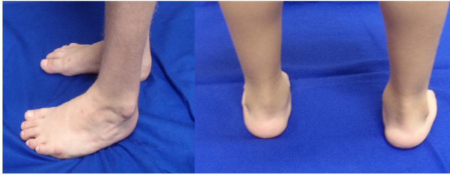
Figura 4 – Paciente de sete anos, cinco anos após tenotomia de Aquiles esquerdo.