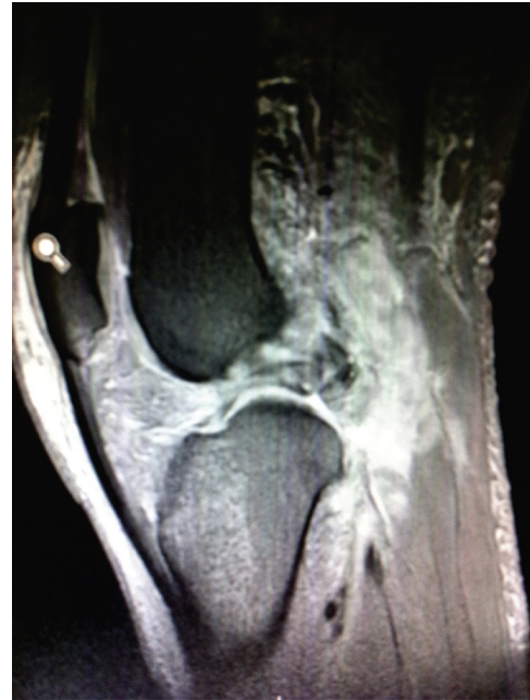
Figura 2 – Imagem da RM da lesão inicial que mostra a lesão ligamentar grave.

O paciente foi colocado em decúbito ventral, submetido à cirurgia de revascularização com interposição de enxerto de veia safena magna, pelo acesso posterior de Trickey. A revascularização foi terminada com cinco horas e 45 minutos após o torniquete da cirurgia de reconstrução ligamentar ser insuflado (tempo total de isquemia do membro) e o paciente foi enviado ao CTI para recuperação pós-operatória. Depois de algumas horas, o paciente retornou ao bloco cirúrgico devido à má perfusão do membro inferior direito, quando foi passado um cateter tipo Fogharty, e foi submetido à fasciotomia descompressiva dos quatro compartimentos da mesma perna. O paciente permaneceu no CTI por mais três dias e recebeu alta hospitalar em boas condições após 24 dias.