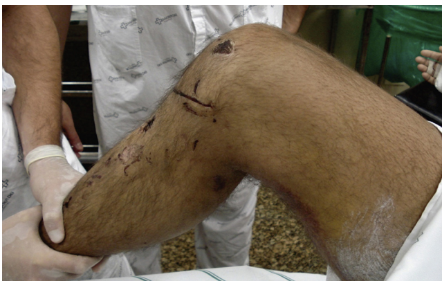
Figura 1 – Aspecto do membro com queda posterior da tíbia.

Convocou-se, em regime de emergência, o cirurgião vascular, o qual atendeu prontamente ao chamado e compareceu à sala de operação em aproximadamente 50 minutos. Não se solicitou exame diagnóstico adicional, devido ao alto grau de suspeição da lesão e à necessidade de intervenção de emergência.