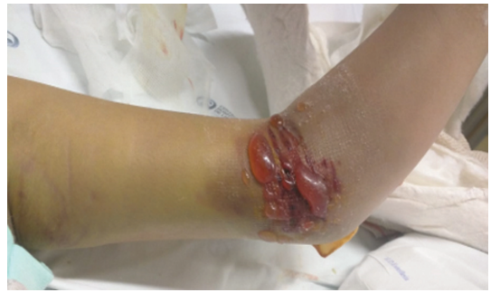
Fig. 4 Edema e bolhas na pele 48 horas após a cirurgia.