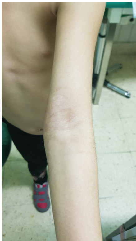
Fig. 6 Pele intacta e extensão completa em três meses de acompanhamento.

Para que o diagnóstico seja feito, é necessária suspeita clínica, e um exame vascular detalhado é crucial, com avaliação de pulsos, temperatura do membro, retorno capilar e oximetria do pulso. 3 O uso de ultrassom intraoperatório ou pós-operatório também é útil para avaliar a patência dos vasos. 4 Em alguns casos, a forma de onda de oximetria de pulso pode ser usada para determinar a necessidade de exploração vascular. 10