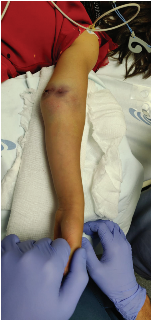
Fig. 2 Equimose na fossa antecubital.