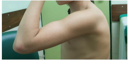
Fig. 5 Faixa de movimento em três meses de acompanhamento.

Quarenta e oito horas após a cirurgia, houve dor persistente e edema sensível progressivo, com bolhas de pele (►Fig. 4). Os pulsos periféricos estavam normais, e não houve exacerbação da dor com mobilização passiva dos dedos. Após a exclusão da síndrome compartimental, foi solicitada uma ultrassonografia duplex venosa, que revelou uma trombose venosa profunda (TVP) da veia umeral.