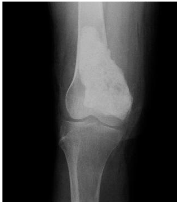
Figura 1 – Rx da lesão pós-cirurgia, evidencia a presença de material de inclusão cirúrgica do tipo cimento ortopédico.

O caso foi encaminhado para consultoria no exterior (EUA). Em exame de ressonância magnética de controle de tratamento cirúrgico foi observada a presença de material de inclusão cirúrgica do tipo cimento ortopédico, igualmente encontrado no raios X, (fig. 1) e demais estruturas ósseas e musculotendíneas dentro do limite de normalidade. Em outubro de 2010 foi feita biópsia de osso para controle histológico, a qual se demonstrou sem alterações histológicas e negativa para presença de neoplasia. Por fim, em laudo de revisão do caso feito em 30 de novembro de 2010, foi relatado que o aspecto histológico, associado ao perfil imuno-histoquímico da neoplasia, era compatível com tumor de Pindborg, com pesquisa de amiloide por vermelho-congo positiva. A paciente, hoje com 38 anos, teve boa evolução, com melhoria da mobilidade do membro inferior direito, e mantém retorno no ambulatório de ortopedia e traumatologia do HSL para acompanhamento. Em consulta de acompanhamento em janeiro de 2016, mantinha boa mobilidade do membro, não apresentava queixas (figs. 2 e 3).