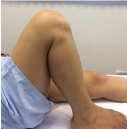
Figura 2 – Flexão do membro pós-recuperação cirúrgica.