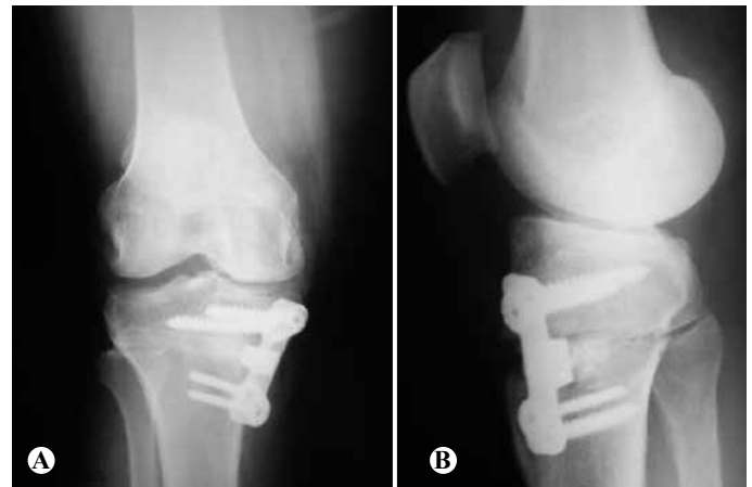
Figura 2 – (A) Radiografia em AP; (B) Vista em perfil de paciente do grupo I submetido à osteotomia e fixado com placa bloqueada e com batente – placa Puddu®.

O ângulo de inclinação posterior da tibia proximal pré-operatório variou entre dois e 16 graus, com média de 8,2° (dp = 3,76). Ocorreu aumento médio de 1,7 graus no ângulo de inclinação posterior ( p < 0,01 ); portanto, com inclinação posterior média pós-operatória de 9,9° (dp = 3,32). Em dois casos ocorreu redução da inclinação do platô de até quatro graus. O maior aumento na inclinação tibial foi de seis graus (Figura 2 – A e B).