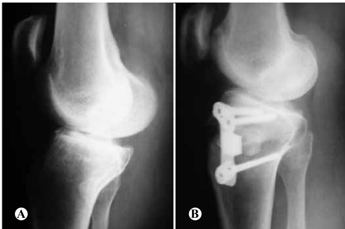
Figura 3 – (A) RX em pré-operatório; (B) RX pós-operatório com redução da altura patelar em paciente submetido à osteotomia e fixado com placa Puddu®.