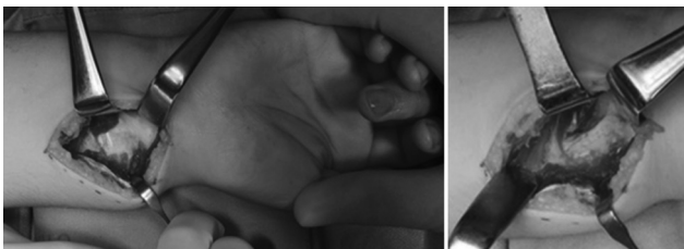
Fig. 1 Abordagem volar do rádio com identificação, secção e excisão do ligamento de Vickers.

Foram analisados os seguintes parâmetros: dados demográficos (gênero, idade de diagnóstico e lateralidade), idade à data da cirurgia, técnica cirúrgica, tempo de consolidação óssea e resultados radiográficos e clínicos. A avaliação radiográfica pré e pós-operatória foi realizada através da medição da inclinação ulnar, afundamento do semilunar, ângulo da fossa semilunar e desvio palmar do carpo. 14 Estas medições foram efetuadas através de exame radiográfico do punho e do antebraço (anteroposterior e perfil), realizado na nossa instituição. Considerou-se o raio-X pré-operatório como o mais próximo da data de cirurgia. A avaliação clínica pós-operatória foi realizada em consulta médica e consistiu na medição das amplitudes articulares do punho e do antebraço, na aplicação da escala visual analógica (EVA) (com avaliação da dor, do défice funcional, do impacto estético e da recomendação do procedimento cirúrgico) e do score Disabilities of the Arm, Shoulder and Hand (DASH, na sigla em inglês). 18 A realização do estudo é autorizada pela Comissão de Ética da Instituição Hospitalar e os pacientes e suas famílias assinaram o termo de consentimento informado.