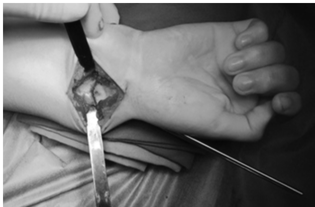
Fig. 4 Realização da osteotomia em cúpula de concavidade distal da região metafisária do rádio distal com osteótomos curvos.

fragmento proximal. É feito o controle fluoroscópico da redução e fixação alcançadas (► Figura 5 ). Dobram-se e cortam-se os fios K, deixando fora da pele uma extremidade que permita a sua remoção na consulta. Realiza-se profilaticamente uma fasciotomia volar limitada e inicia-se o encerramento reaproximando parcialmente o retalho do pronator quadratus com fio absorvível. Encerra-se o tecido celular subcutâneo e a pele com fio absorvível. Realiza-se uma imobilização gessada antebraquial, que se bivalva no bloco operatório, prevenindo o risco de edema/síndrome compartimental pós-cirúrgicos.