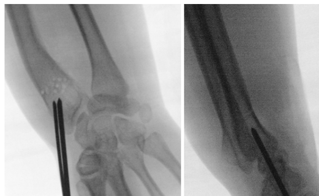
Fig. 3 Introdução de 2 fios de Kirschner (2.0/2.4mm) paralelos ou divergentes ao nível da estilóide radial e orientados no sentido da região metafisária do rádio distal previamente fenestrada, sem a ultrapassar.