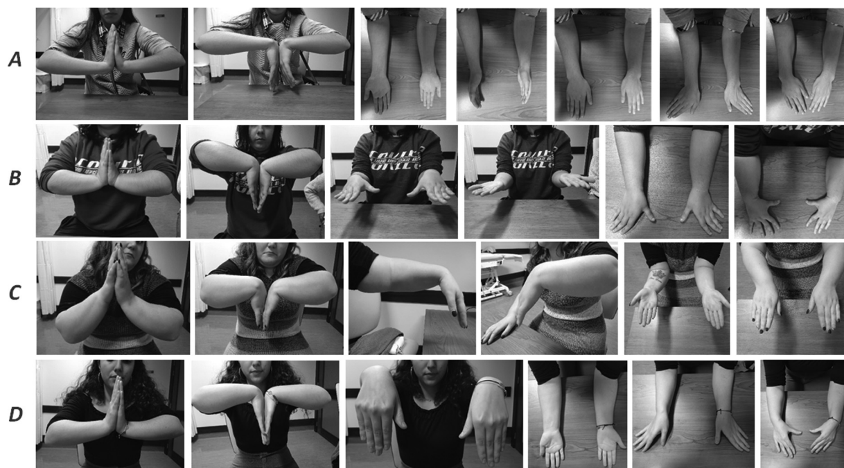
Fig. 6 Fotografia clínica da mobilidade pós-operatória do punho e antebraço. A – paciente com procedimento cirúrgico bilateral; B – paciente com procedimento cirúrgico bilateral; C – paciente com procedimento cirúrgico à esquerda; D – paciente com procedimento cirúrgico à direita.

Abreviações: \Delta , variação; DASH, disabilities of the arm, shoulder and hand; EVA, escala visual analógica.