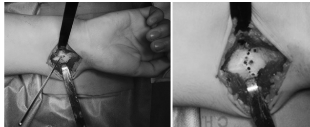
Fig. 2 Fenestração em cúpula de concavidade distal do córtex volar e dorsal da região metafisária do rádio distal com fio de Kirschner (1.6 mm).

Realiza-se uma abordagem volar do rádio através de uma incisão longitudinal ( \pm 7 cm), explorando o espaço entre o flexor carpi radialis e a artéria radial. Identifica-se o músculo pronator quadratus e eleva-se um retalho em "L" de base distal para exposição da face volar do rádio. Identifica-se o ligamento de Vickers, que é seccionado e excisado ( Figura 1 ). Sob observação direta e apoio de fluoroscopia, identifica-se a região metafisária do rádio a osteotomizar, evitando lesar a articulação radiocubital distal e a fise distal do rádio (quando presente). Realiza-se uma disseção subperiosteal circunferencial do rádio e, com um fio Kirshner (K) 1.2/1.6mm, inicia-se a fenestração em cúpula (de concavidade distal) do córtex da metáfise distal volar e dorsal do rádio ( Figura 2 ). Introduzem-se percutaneamente dois fios K de 2.0/2.4mm paralelos ou divergentes através da estilóide radial e orientados no sentido da região fenestrada da osteotomia, sem a ultrapassar ( Figura 3 ). Realiza-se a osteotomia em cúpula do rádio distal com osteótomos curvos ( Figura 4 ) e procede-se a uma manobra de redução com tração longitudinal, desvio radial, pronação e desvio dorsal do fragmento distal. Enquanto o cirurgião principal mantém a redução alcançada, o cirurgião ajudante avança os fios K através do foco da osteotomia até obter uma fixação cortical no