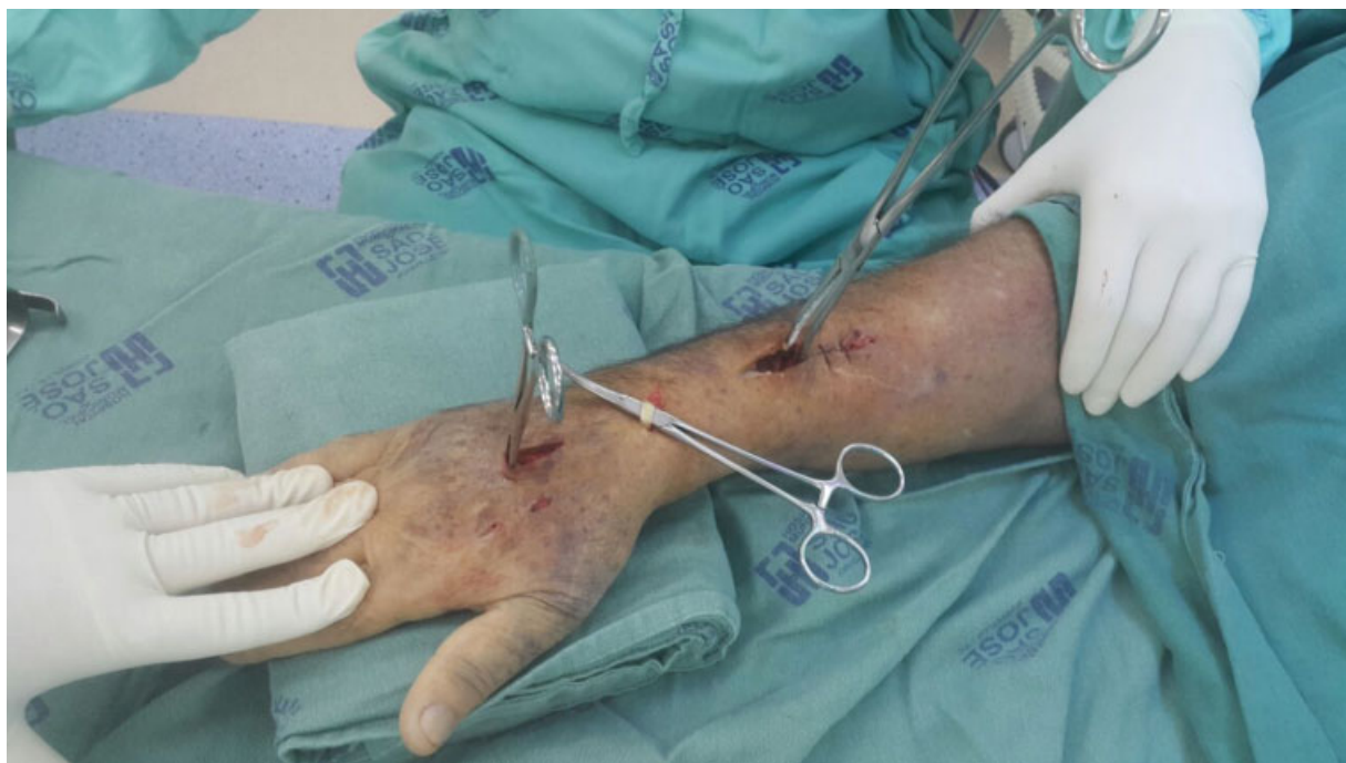
Fig. 2 Intraoperatório pela técnica de placa ponte.

A placa de compressão dinâmica (PCD) foi deslizada justa óssea, afastando o tendão extensor longo do polegar no terceiro túnel por um acesso de aproximadamente 3 cm no tubérculo de Lister. A placa é passada abaixo dos túneis extensores, e o acesso é realizado para isolar o tendão do extensor longo do polegar e se certificar de que a placa está abaixo dos tendões. Foi realizada a fixação com dois parafusos