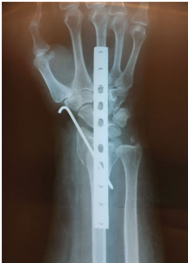
Fig. 3 Radiografia do pós-operatório de placa dorsal.

distais, a redução da fratura, e, depois, a fixação com dois parafusos proximais. Se necessário, complementou-se a síntese com FKs (► Figura 3 ).