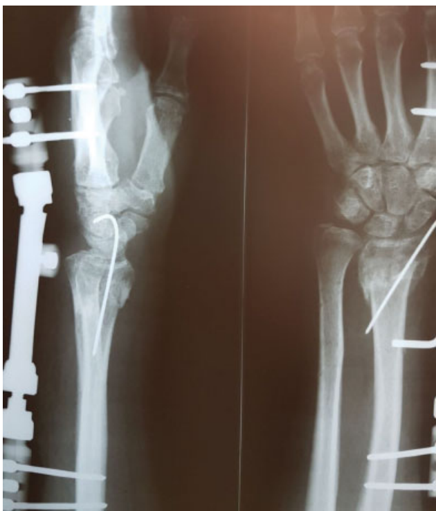
Fig. 1 Radiografia do pós-operatório com fixador externo.

O recrutamento dos pacientes aconteceu no período de dezembro de 2017 a maio de 2018 durante os retornos ambulatoriais no Hospital Municipal São José (Joinville, SC), nos quais foi realizado o tratamento cirúrgico, sempre pelo mesmo cirurgião de mão, chefe do serviço. Foram excluídos do estudo pacientes com fraturas associadas no mesmo membro; fraturas distais do rádio expostas; fratura