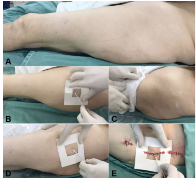
Fig. 1 Figuras ilustrando os tempos de coleta das amostras. (A) Paciente após ser anestesiado, com o membro a ser operado isolado com campos; (B) Coleta de amostra antes da degermação; (C) Realizada degermação com clorexidina degermante e retirado o excesso; (D) Coleta de amostra após a degermação; (E) Coleta de amostra ao final da cirurgia, após a sutura da ferida operatória, em ambiente ainda estéril.

Todos os tubos de ensaio em que foram armazenadas as amostras colhidas, assim como as placas de cultura, foram numerados de acordo com cada paciente, seguindo sequencialmente os números de 1 a 170. Os tempos cirúrgicos de coleta foram identificados pelos números 0, 1 e 2, sendo que o número 0 corresponde aos materiais coletados na pré-degermação, o número 1, aos materiais coletados no tempo pós-degermação com clorexidina degermante 4%, seguido pela retirada do excesso com compressa seca ou embebida com álcool etílico a 70%, e o número 2, aos materiais coletados ao final do ato operatório (► Figura 1 ).