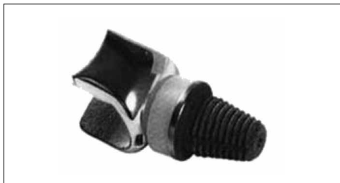
Figura 1 – A prótese METIS-Newdeal®.

A prótese METIS® é constituída por três componentes: metatarsiano (em liga de cromo-cobalto), falângico (em titânio), e um componente de interposição de polietileno de terceira geração. Os componentes metatarsiano e falângico são revestidos por hidroxiapatita. O desenho tenta preservar a anatomia normal da articulação MTF, preservando os ossos sesamoides e as suas inserções tendinosas, esperando-se um arco de movimento de cerca de 85° (-20:0:60) (Figura 1).