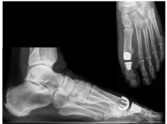
Figura 3 – Imagem de radiografia após a cirurgia.

Relativamente ao grau de satisfação após a cirurgia, apenas um paciente referiu estar desiludido com os resultados, muito à custa de uma intercorrência infecciosa que sofreu e que condicionou os resultados.