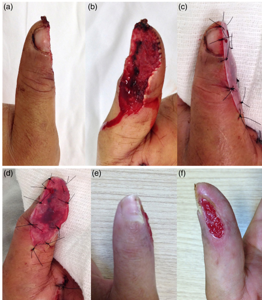
Figura 2 – Caso clínico 2: Paciente do sexo feminino, 34 anos. Trauma por esmagamento em dedo médio; (a) aspecto do dorso do dedo com lesão complexa de leito ungueal; (b) ferimento oblíquo volar (difícil para retalhos); (c) Plástico é recortado em formato de U; (d) aspecto do intraoperatório; (e-f): pós-operatório tardio. Presença de unha viável.

da falange. Contudo, o formato e o aspecto do segmento residual é bem próximo do original. As figuras 1-3 ilustram casos clínicos com a técnica descrita.