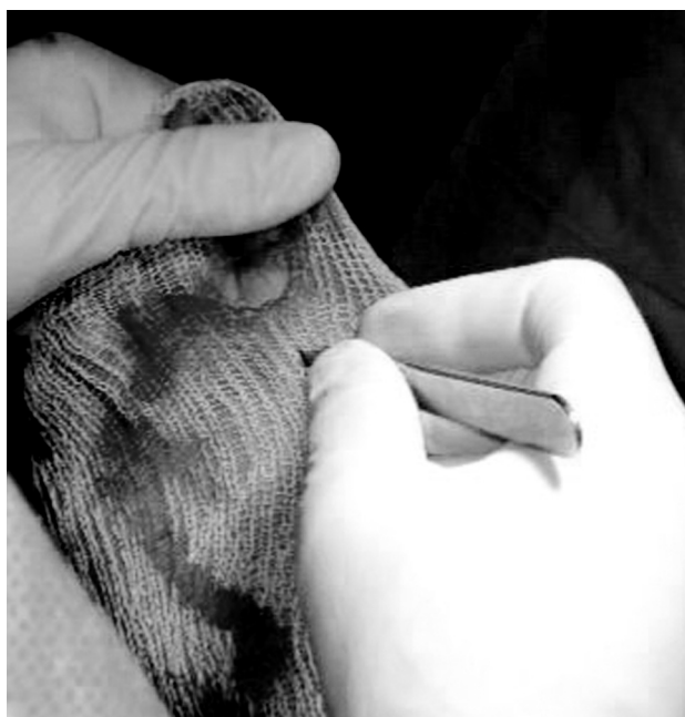
Fig. 1 Liberação percutânea do tendão da adutora.

teriormente, a cabeça metatarsal pode ser deslocada mais de 75% do diâmetro do primeiro metatarso, se necessário, permitindo correções de AIM graves. É uma osteotomia completa, e deve ser estabilizada com fio K intramedular. Controle a posição com fluoroscópio em vistas laterais e anteroposteriores.