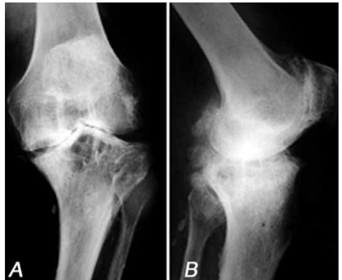
Figura 1 – Aspecto radiográfico de paciente com geno varo grave, submetido à técnica proposta.

Revisamos seis pacientes com deficiência óssea do tipo T2A pela classificação da AORI, que foram submetidos à artroplastia total primária do joelho pelos autores sêniores (CAJP e MKJ), no período de janeiro de 2007 a fevereiro de 2009 e que apresentavam perda óssea importante, do tipo falha óssea não contida, alcançando parte importante da margem do planalto tibial. Os pacientes foram avaliados com radiografias em AP, perfil (Figura 1) e oblíquas do joelho, bem como radiografia em AP panorâmico do membro inferior, para avaliação do eixo mecânico.