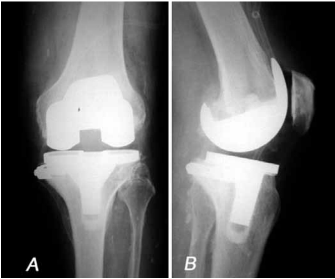
Figura 3 – Aspecto radiográfico final.

um teste manual cuidadoso. Além do mais, a ancoragem dos parafusos raramente era segura, o que nos induziu agregar uma placa de suporte com uma cinta de contenção.