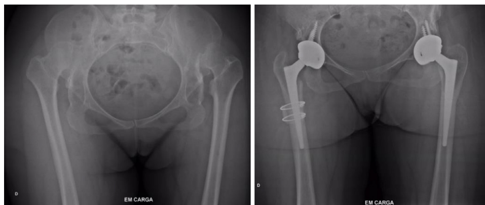
Figura 2 – Exemplo do paciente MMMM. Radiografias antes e após artroplastias por luxação alta bilateral.

nas ancas afetadas e limitação funcional, em particular da capacidade de marcha (tabela 2). A via de abordagem da anca usada em todos os casos foi a posterior. Optou-se por osteotomia de encurtamento do fêmur em todas as ancas, efetuada em nível subtrocantérico em 72,72% dos casos e os restantes em nível supracondiliano. Todas as osteotomias supracondilianas foram fixadas com placa e parafusos. Nas osteotomias subtrocantéricas que ficaram estáveis após a aplicação da haste femoral não foi aplicada qualquer fixação extra, o que aconteceu em metade desse tipo de osteotomias. Na outra metade, devido a não se ter obtido estabilidade suficiente após colocação da haste femoral, essa foi reforçada com placa e parafusos e/ou cabos de aço. Em nenhum caso foi necessário qualquer outra libertação de tecidos moles para obter uma