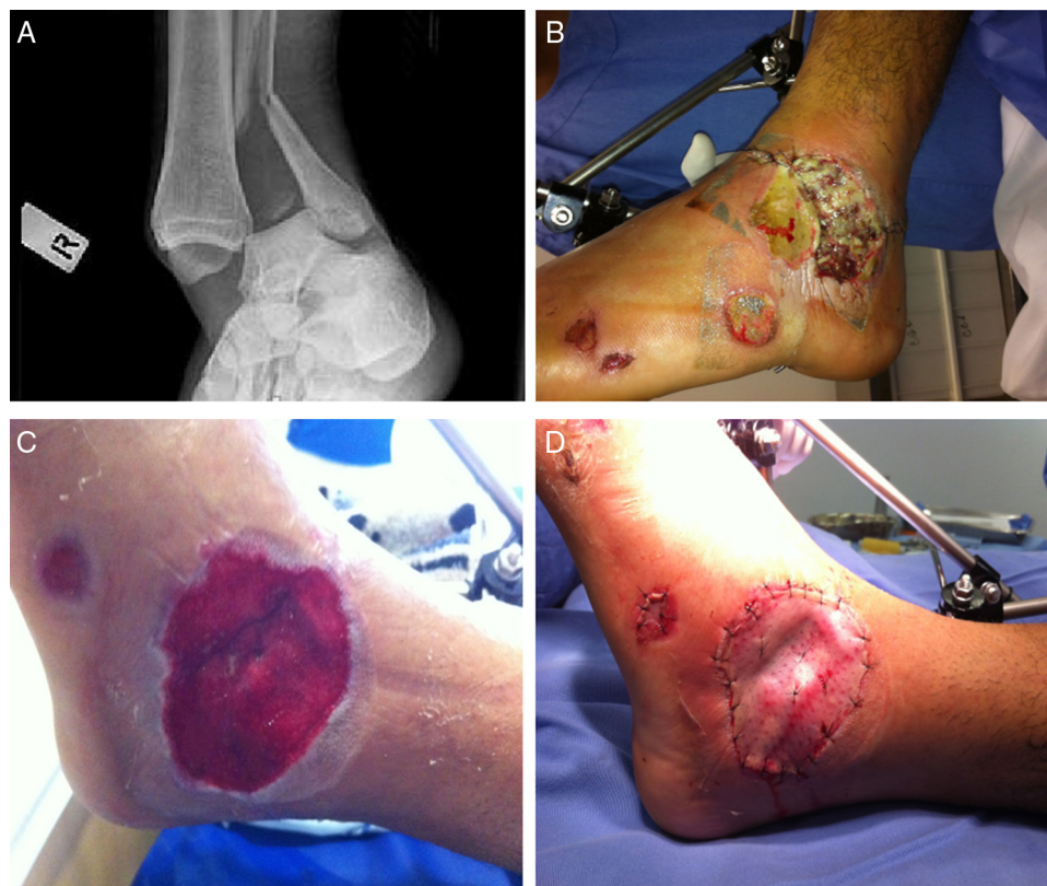
Figura 1 – Paciente vítima de acidente motociclístico. A, presença de fratura exposta de tornozelo; B, fixação externa do tornozelo e presença de infecção local; C, aspecto após 28 dias de terapia a VAC; D, enxertia de pele.

o Staphylococcus aureus (tabela 2). Todos os pacientes, após o diagnóstico, foram submetidos a tratamento cirúrgico (debridamento e irrigação local de ferida), seguido do tratamento tópico da lesão pelo curativo por pressão negativa.