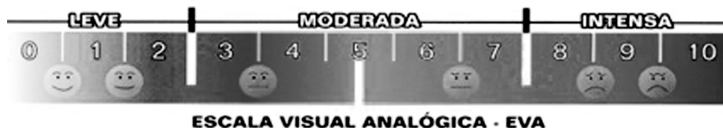
Fig. 2 Escala Visual Analógica da dor.

O projeto foi submetido ao Comitê de Ética em Pesquisa (CEP) da instituição, com o número de Certificado de Apresentação para Apreciação Ética – CAAE: 50651315.8.0000.0007, e recebeu o parecer substanciado com o número 1.774.789 em 13 de outubro de 2016, e foi também aprovado no Clinical Trials, com o registro RBR – 7PCKQT. Todos os pacientes que porventura concordassem participar da pesquisa assinavam o TCLE.