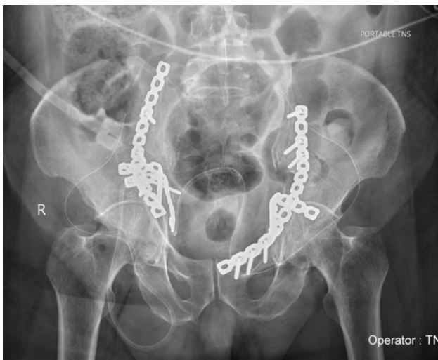
Figura 3 – Radiografia obtida no período pós-operatório imediato mostra a fixação da fratura bilateral de lâmina quadrilátera.