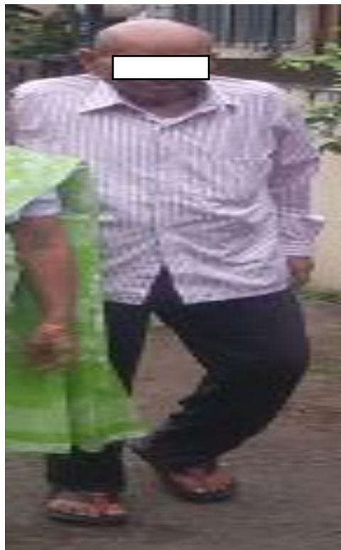
Figura 6 – Ao acompanhamento de sete meses, paciente caminhava sem apoio.

Em conclusão, este caso foi um raro exemplo de fratura bilateral da lâmina quadrilátera causada por atividade convulsiva, para a qual um alto nível de suspeita de tal fratura deve ser mantido ao avaliar pacientes após episódios convulsivos.