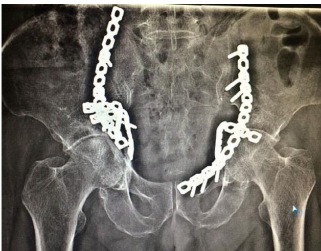
Figura 5 – Ao acompanhamento de sete meses, radiografia mostra redução congruente bem mantida do quadril.

No presente caso, como não houve lesão associada na coluna acetabular, foi usada a abordagem ilioinguinal e uma placa-mola (placa de reconstrução de 3,5 mm) contornada sobre a borda pélvica, que apoiava a lâmina quadrilátera reforçada com placa de borda pélvica. O paciente foi mobilizado da cama para cadeira de rodas imediatamente após a cirurgia. A carga não foi autorizada por seis semanas. Posteriormente, foi permitida carga gradual e deambulação com apoio (fig. 4). Nos seguimento de sete meses, a radiografia apresentou uma redução congruente bem mantida do quadril (fig. 5) e o paciente deambulava sem apoio (fig. 6).