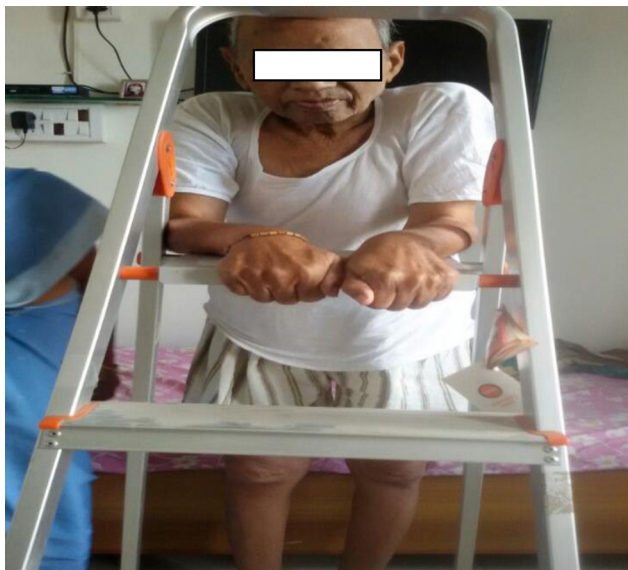
Figura 4 – Ao acompanhamento de dois meses, paciente em pé com apoio.