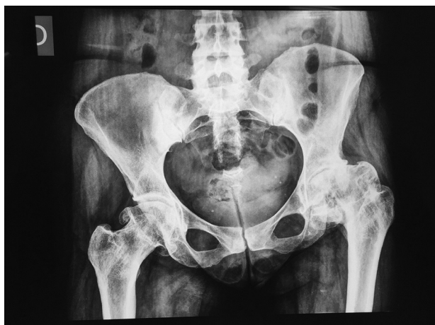
Fig. 1 Radiografia em anteroposterior da bacia – coxartrose bilateral, demonstra encurtamento de membro inferior esquerdo.

A paciente foi submetida a raquianestesia para analgesia com codeína, sem bloqueio motor. Posicionada em decúbito lateral direito, os eletrodos de monitoração eletroneurofi-