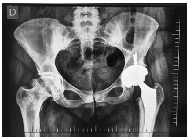
Fig. 3 Foto demonstrativa de dismetria residual na avaliação maleolar no pós-operatório.

na recuperação da função das estruturas comprometidas e comprovar que a técnica cirúrgica aplicada naquele momento não foi nociva ao paciente.