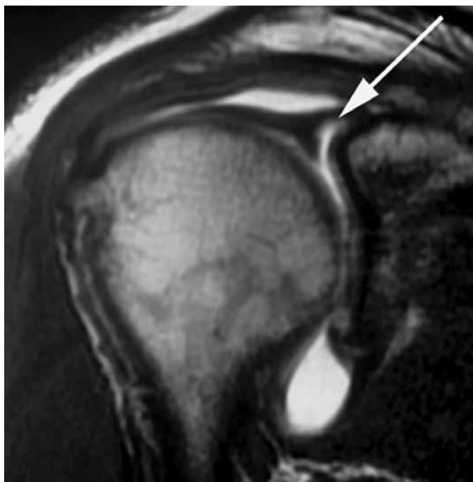
Figura 1 – Imagem mostrando corte coronal de artroressonância magnética do ombro direito de um paciente com lesão do lábio glenoidal superior (seta branca).

A classificação utilizada para a lesão SLAP foi a proposta por Snyder et al (8) e modificada por Maffet et al (4) , e o tipo II foi o mais frequente, correspondendo