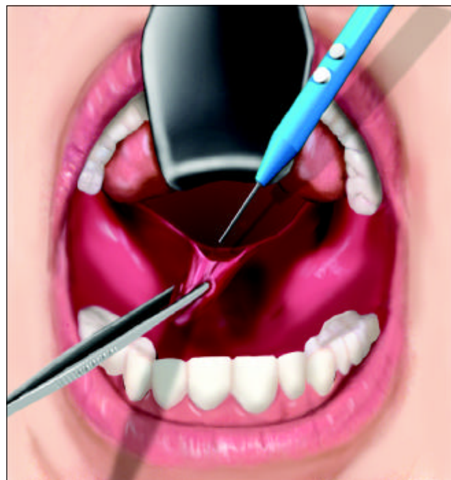
Figura 1. Ressecção parcial da úvula, na altura em que será suturada na superfície anterior do palato

Foram avaliados, no pós-operatório, a dor, medida através de relatos dos pacientes, necessidade do uso de analgésicos e reintrodução da dieta normal; complicações imediatas (hemorragia, hematoma, edema obstructivo de vias aéreas) e tardias (insuficiência velofaríngea, mudança de voz, estenose, mioclonia, perda do paladar, infecção bacteriana, refluxo nasal de alimentos) 16 e remissão do ronco. Esses dados foram avaliados de forma subjetiva através das informações prestadas pelo paciente e seus familiares. Não se realizou polissonografia no seguimento de seis meses porque o objetivo do estudo foi avaliar apenas a resolução da roncopatia.