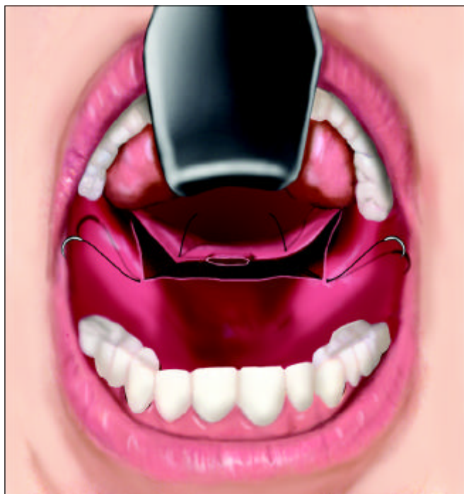
Figura 3. Eversão e sutura