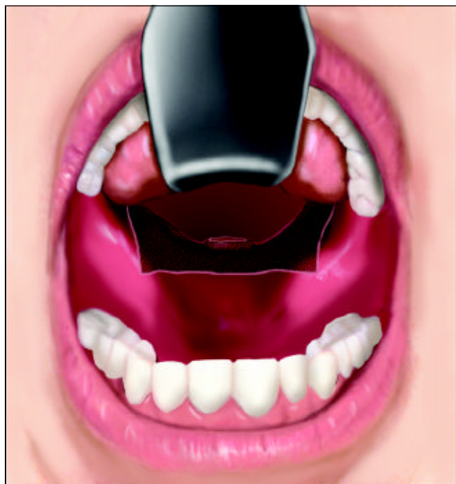
Figura 2. Mucosa anterior do palato mole ressecada, sem perda de tecido muscular

A terapêutica cirúrgica para o ronco consiste no tratamento da hipertrofia do palato, amígdalas e cirurgia nasal. Entre as técnicas descritas na literatura para o palato, destacam-se a cirurgia com laser de CO 2 , a somnoplastia, a uvulopalatofaringoplastia e a ressecção parcial de palato (RPP). A abordagem do palato para tratamento da roncopatia