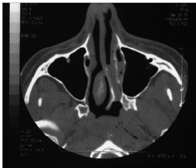
Figura 2. Caso com características tomográficas similares ao caso da foto 1, atresia coanal esquerda, seios maxilares simétricos e ausência de sinusopatia.

A análise estatística com o método de Kruskal-Wallis demonstrou não haver diferença estatística significativa entre o tamanho dos seios maxilares neste grupo de pacientes (Valor = 4,846, p = 0,183)