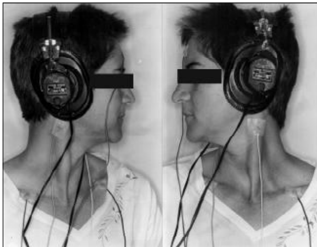
Figura 1. Posição do paciente em rotação lateral e posição dos eletrodos de superfície ativos, de referência e terra

O teste Qui-quadrado avaliou a presença e ausência de sintomas entre os grupos comparando com os resultados do VEMP (Tabela 3). Não houve diferença estatística significante. Embora não-significante, o grupo com presença de sintomas apresentou maior número de ausências de respostas (34,8%), indicando uma tendência que poderia ser mais bem avaliado com um grupo de estudo maior.