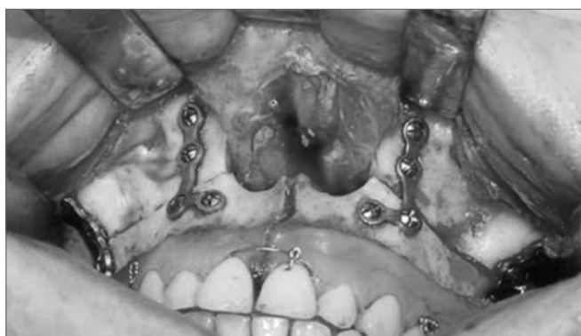
Figura 5. Bloqueio maxilo-mandibular e fixação interna rígida.

A sutura do palato mole foi realizada por camadas com Vycril da Ethicon®, o palato duro foi suturado em um só plano com o mesmo fio. A sutura da mucosa na região vestibular foi realizada de forma contínua em um plano com o mesmo fio.