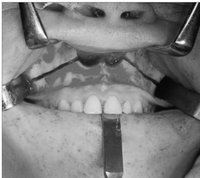
Figura 2. Osteotomia Le Fort I da Maxila.