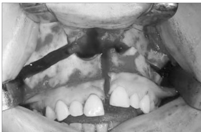
Figura 3. Osteotomia vertical levando a separação sagital da maxila.

Uma incisão lateral à úvula na região de palato mole e mediana seguindo todo o palato duro até gengiva entre incisivos foi realizada. Na região de palato mole a incisão foi de espessura total, expondo a nasofaringe. Os dois retalhos palatinos foram descolados, preservando a artéria palatina maior. A maxila foi então dividida em dois segmentos e posicionada lateralmente com retrator de palato de Coldman (Figura 4).