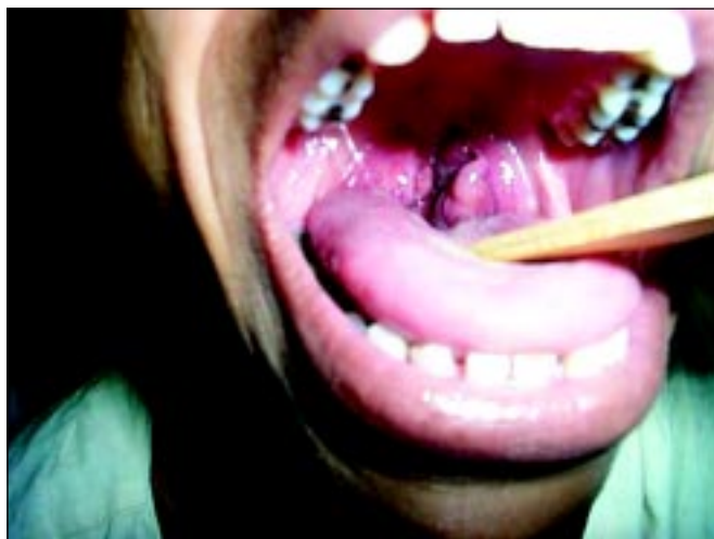
Figura 1. Hipertrofia e acometimento de tonsilas palatinas pelo linfoma não-Hodgkin

Rinoscopia anterior: sem alterações significativas ao exame, sem lesões visíveis.