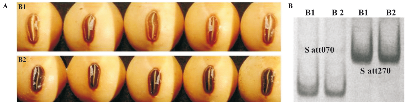
FIGURA 1. Análise da pureza genética em sementes de soja da cultivar CD 222 com variação na cor do hilo. A) B1: sementes com hilo marrom claro; B2: sementes com (hilo preto padrão da cultivar). B) Padrões moleculares dos “bulks” obtidos com os primers Satt070 e Satt270.

genética utilizando o loco microsatélite Satt070 em três sementes deste grupo. Assim, mesmo entre as sementes com cor do hilo uniforme pode existir contaminação genética detectada por meio de locos SSR. O loco Satt070 apresentou um elevado valor de informatividade (0,74) em trabalho anteriormente realizado para a caracterização de um conjunto de 53 cultivares de soja por meio de marcadores microsatélite em géis de agarose, o que indica que este loco microsatélite é eficiente na detecção de diferenças (Vieira et al., 2009).