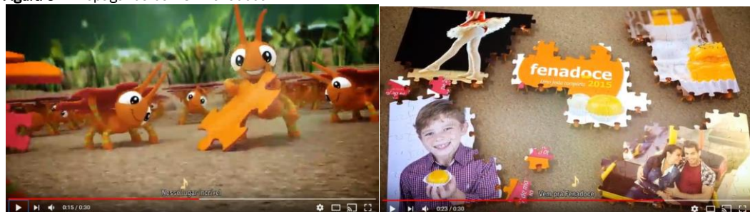
Figura 5 – Propaganda da 23° Fenadoce: