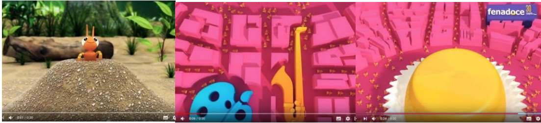
Figura 7 – Propaganda da 24ª Fenadoce.