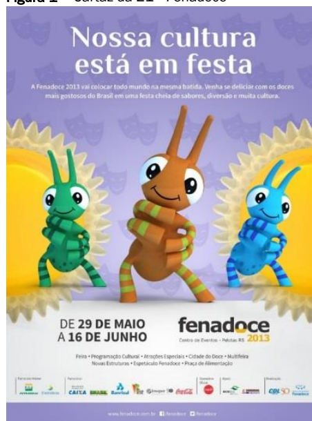
Figura 1 – Cartaz da 21° Fenadoce

Na 21° edição da Fenadoce o tema ( slogan ) foi “A nossa cultura está em festa” e apresenta material em formato de cartaz (figura 1). É possível analisar nos textos o destaque ao aspecto cultural do evento e os doces como sendo um diferencial no contexto. O cartaz traz a frase “A Fenadoce 2013 vai colocar todo mundo na mesma batida. Venha se deliciar com os doces mais gostosos do Brasil em uma festa cheia de sabores, diversão e muita cultura”. Quanto às imagens, destacam-se as formigas e em segundo plano se apresentam quindins e símbolos de teatro.