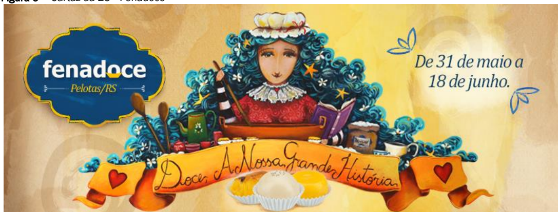
Figura 9 – Cartaz da 25ª Fenadoce