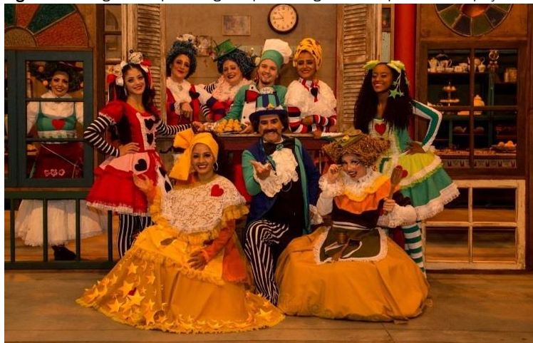
Figura 11 - Imagem das personagens que interagem com o público no Espaço Doce da Arte.