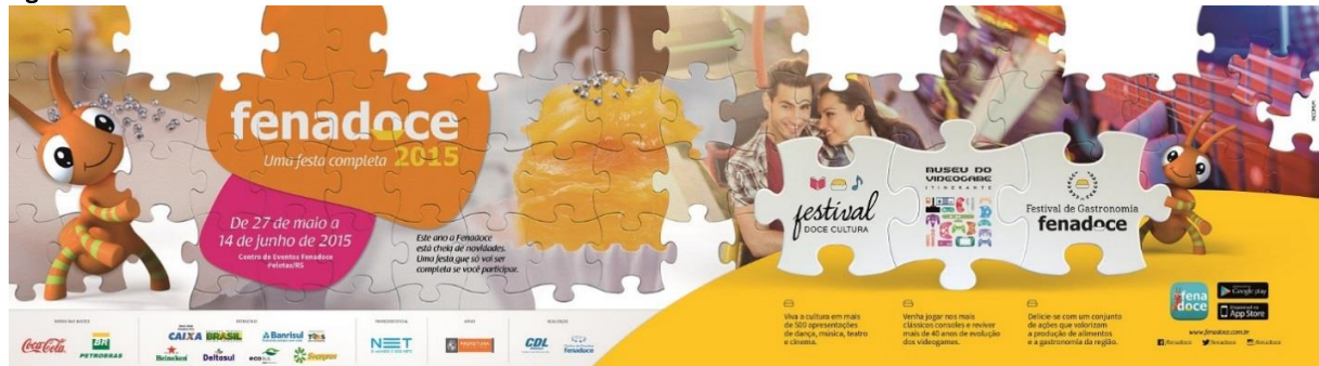
Figura 6 – Cartaz da 23° Fenadoce.