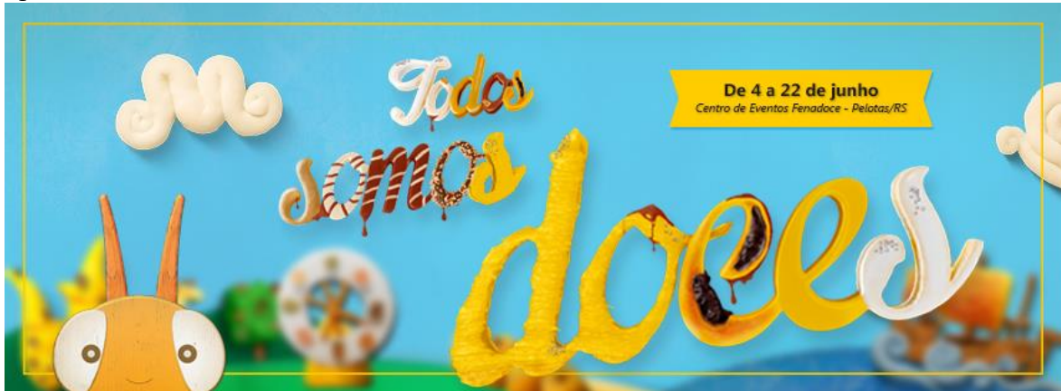
Figura 3 – Capa na página do Facebook da Fenadoce de 2014: