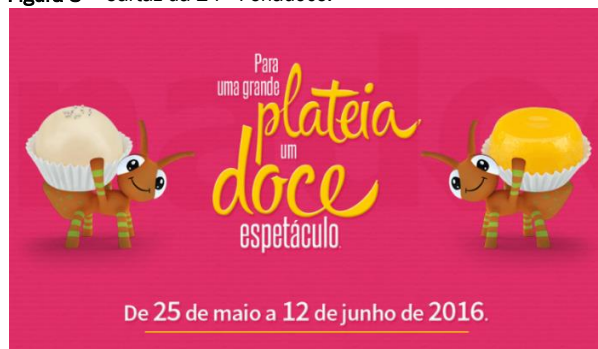
Figura 8 – Cartaz da 24° Fenadoce.

Fonte: http://www.revistarotars.com.br/2016/05/pelotas-se-prepara-para-a-fenadoce-2016/