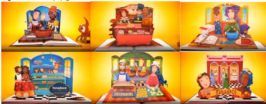
Figura 10 – Cenas da propaganda da 25ª Fenadoce, em 2017