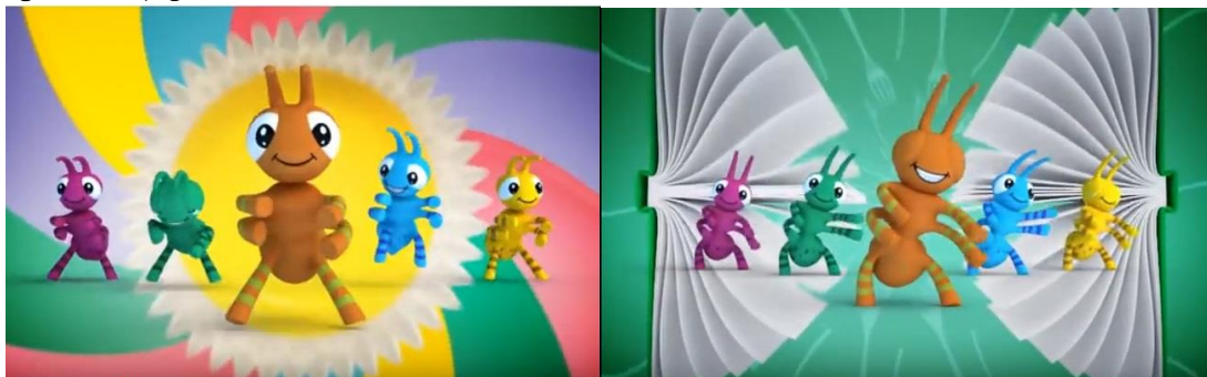
Figura 2 – Propaganda da 21ª Fenadoce: