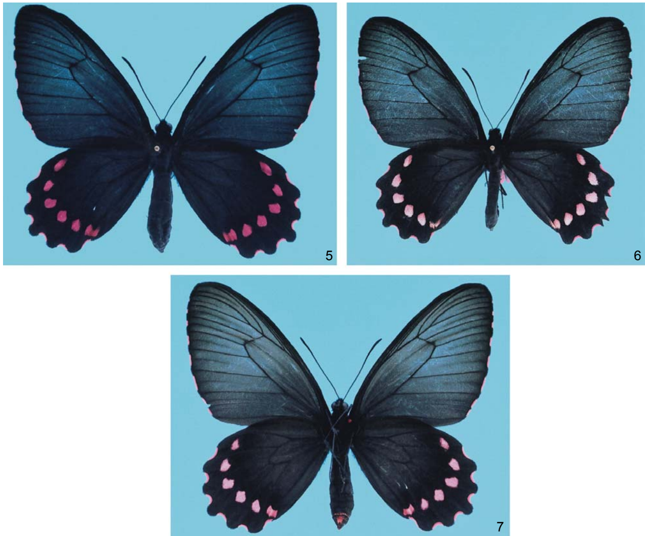
Figuras 5-7. Parides burchellanus : (5) fêmea, face dorsal, 21-IV-2003, mesma procedência do exemplar da figura 1, O. Mielke leg., exemplar recém eclodido, franjas rosas na base e brancas na parte distal e manchas alares rosa vivo; (6) fêmea, face dorsal, 5-I-2003, mesma procedência do exemplar da figura 1, exemplar já voado, franjas brancas e manchas alares rosa claro; (7) fêmea, face ventral, mesmo exemplar da figura 5.

sendo o último nome o mais antigo, logo prevalecendo sobre o anterior. A genitália dos exemplares com franjas rosas ( jaguarae ) e brancas ( burchellanus ) não diferem entre si.