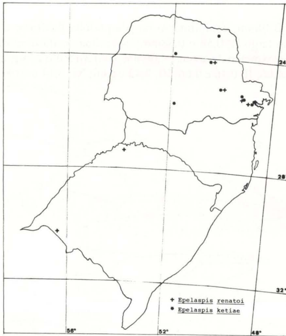
Fig. 7. Distribuição geográfica das espécies do gênero Epelaspis na região sul do Brasil.

Holótipo fêmea. BRASIL, Paraná : Telêmaco Borba, 13-X-1986, Profaupar leg. . Alótipo: Curitiba (Capão da Imbuia), 30-XII-5-I-1979, A.F. Kumagai leg. . Parátipos: Telêmaco Borba, uma fêmea 15-IX-1986; duas fêmeas 22-IX-1986; uma fêmea 13-X-1986; duas fêmeas 20-X-1986; uma fêmea 10-XI-1986; uma fêmea 17-XI-1986; uma fêmea 8-XII-1986, Profaupar leg. .