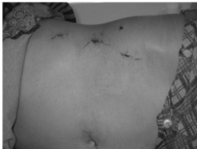
Figura 1 - Posição dos trocarter na simpatectomia lombar esquerda.

ao nível da cicatriz umbilical, para guiar a entrada do primeiro trocarte para o acesso retroperitoneal, evitando, assim, a perfuração do peritônio ao nível do flanco esquerdo. Procedeu-se a exsuflação intraperitoneal e insuflação extraperitoneal. O primeiro trocarte de 10 mm usado para a óptica, foi disposto a meia distância entre a crista ilíaca e a borda costal inferior esquerda, na altura da linha axilar média. Uma vez estabelecido o espaço extraperitoneal inicial, procedemos à colocação dos demais trocarter, equidistantes do primeiro, a 6 cm deste, anteriores, sendo um superior e outro inferior. O quarto trocarte ainda mais anterior, foi colocado para afastar o peritônio. Utilizamos portanto uma técnica de acesso transperitoneal apenas para a colocação do trocarte extraperitoneal sob visão laparoscópica, evitando perfuração do peritônio ao nível do flanco (Figura 1).