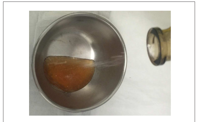
Figura 5 - Aplicação lenta do enxerto ósseo.