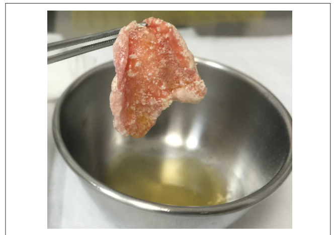
Figura 6 - i-PRF polimerizado com o enxerto ósseo.