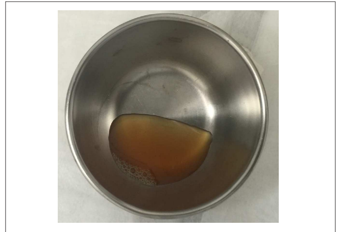
Figura 4 - i-PRF dispensado na cuba metálica.

após cinco minutos foram acrescentadas as partículas de enxerto ósseo aos poucos (Figura 5). E em 15 minutos, é possível observar o início da polimerização, estando o material pronto para o uso no tempo total de 20 minutos, podendo ser removido para realização do enxerto ósseo (Figura 6).