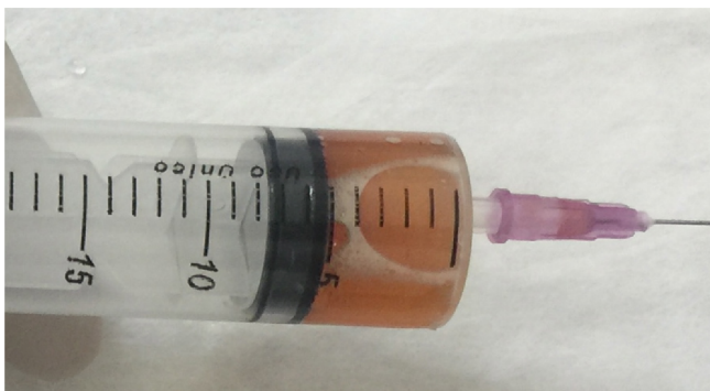
Figura 3 - Cinco mililitros do i-PRF obtidos após a coleta nos tubos.