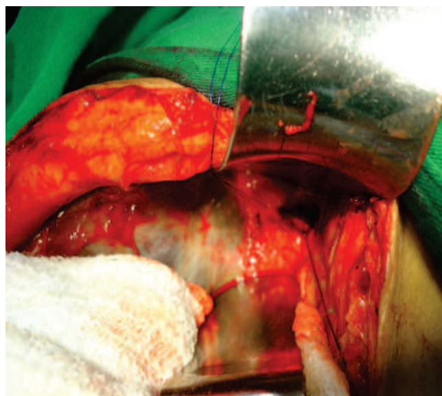
Figura 2 - Visão na cirurgia da pequena abertura do ducto hepático direito e da abertura ampliada do ducto hepático esquerdo.

Roux, sendo que em dois deles (7,5%) os ductos hepáticos direito e esquerdo foram implantados separadamente no jejuno (Figura 2).