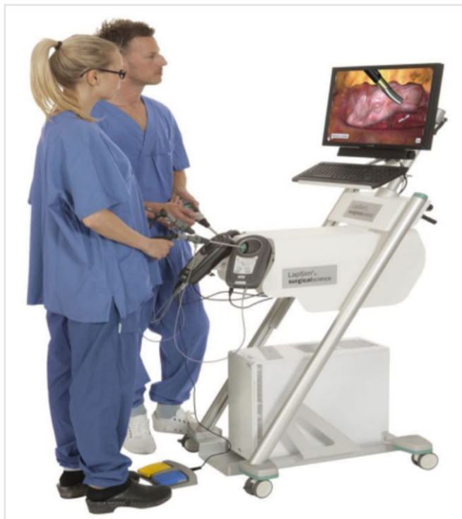
Figura 1. Simulador de Cirurgia Videolaparoscópica.

de dificuldades crescentes. São doze exercícios, conforme exemplificados na figura 2, que incluem: navegação pela câmera, navegação por instrumento, coordenação, sutura, prensão, corte, inserção de cateter, aplicação de clipe, levantamento e prensão, manipulação de intestino e dissecação fina (Tabela 1).