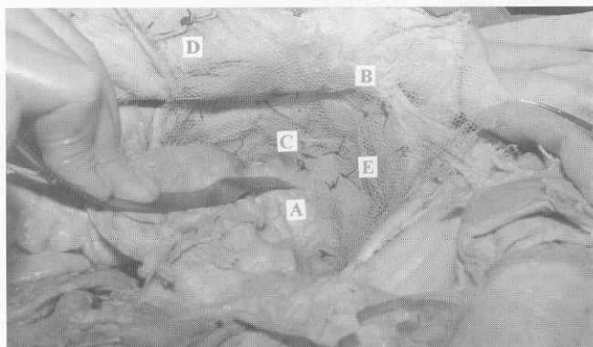
Figura 2 – Peça de dissecação cadavérica a fim de demonstrar a colocação da tela e referências anatômicas: A) Fáscia pré-vesical; B) Ossos púbicos; C) Parede pélvica; D) Parede abdominal anterior; E) Tela fixada conforme técnica descrita

tela dupla de polipropileno. A tela ultrapassava em mais de 10cm o local da separação óssea e foi fixada ântero-lateralmente aos ramos da púbis e ligamento de Cooper, sem tensão. Os pontos foram fixados através de orifícios feitos nos ossos