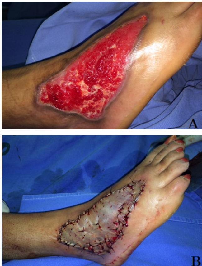
Figura 1. Perda de substância em dorso do pé. A) Pré-operatório; B) Enxerto de pele parcial.