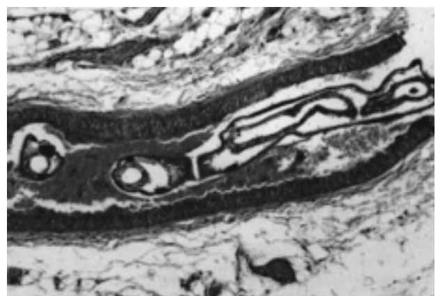
Figura 2 - Artéria de mesoapêndice exibindo verme adulto de Angiostrongylus costaricensis na luz.