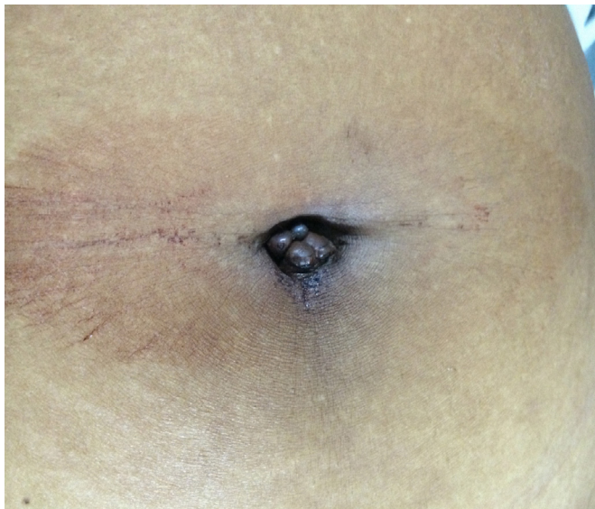
Figura 2. Endometrioma com sangramento ativo: manifestação clínica clássica no período menstrual.