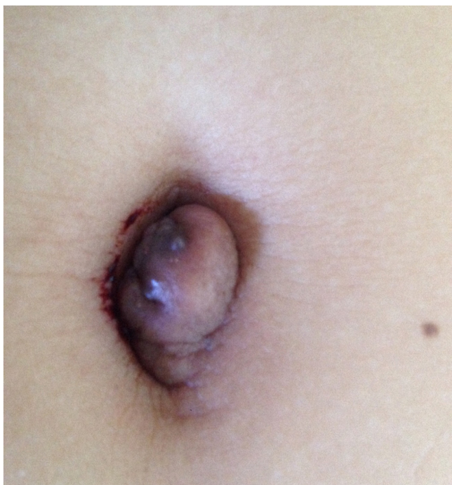
Figura 3. Nódulo umbilical único, com sangramento ativo e de crescimento progressivo.

A queixa principal era de dor e sangramento umbilical no período menstrual associado a tumor umbilical (100%). A idade variou de 28 a 45 anos (média de 33 anos). O tamanho das lesões variou de 1,0cm a 2,5cm (média de 1,9cm) com coloração violácea em cinco pacientes (83%) e eritemato-violácea em uma (16%). Em relação ao tempo de duração dos sintomas, este variou de um a três anos (média de um ano e um mês). O