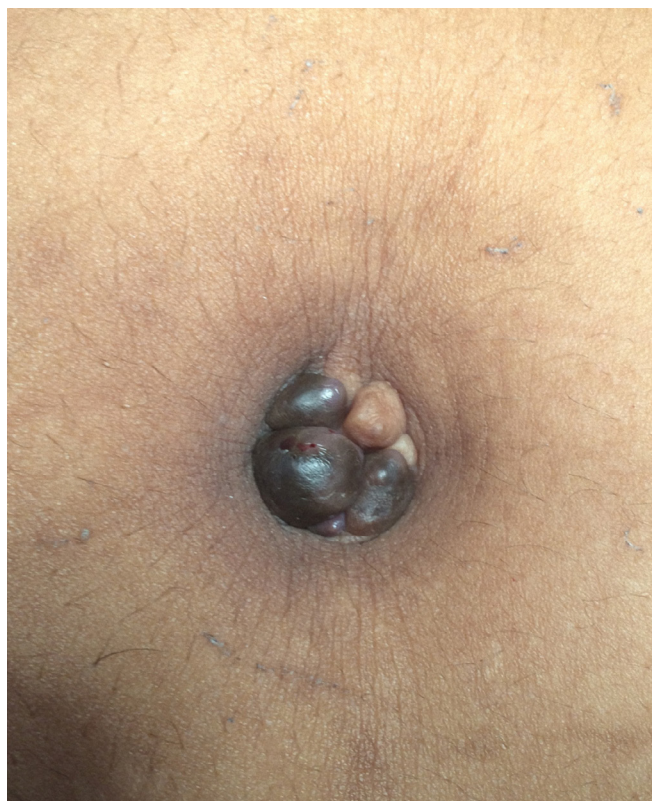
Figura 1. Endometrioma umbilical: nódulos em região umbilical, acastanhados, de crescimento progressivo e sintomatologia mais pronunciada durante período menstrual.

Durante o período do estudo foram admitidas oito pacientes com queixas de tumor em cicatriz umbilical associado a sangramento e/ou dor umbilical no período menstrual, com diagnóstico clínico de endometriose umbilical (Figuras 1, 2 e 3). Duas delas foram classificadas como endometriose umbilical secundária e não foram incluídas no estudo por possuírem cirurgias abdominais prévias (um caso por laparotomia exploradora por ferimento por arma branca e surgimento de endometriose umbilical e de parede abdominal um ano e meio depois e outro por cesariana prévia e endometriose umbilical três anos depois). As seis outras pacientes foram classificadas como portadoras de endometriose umbilical primária e foram incluídas no estudo.