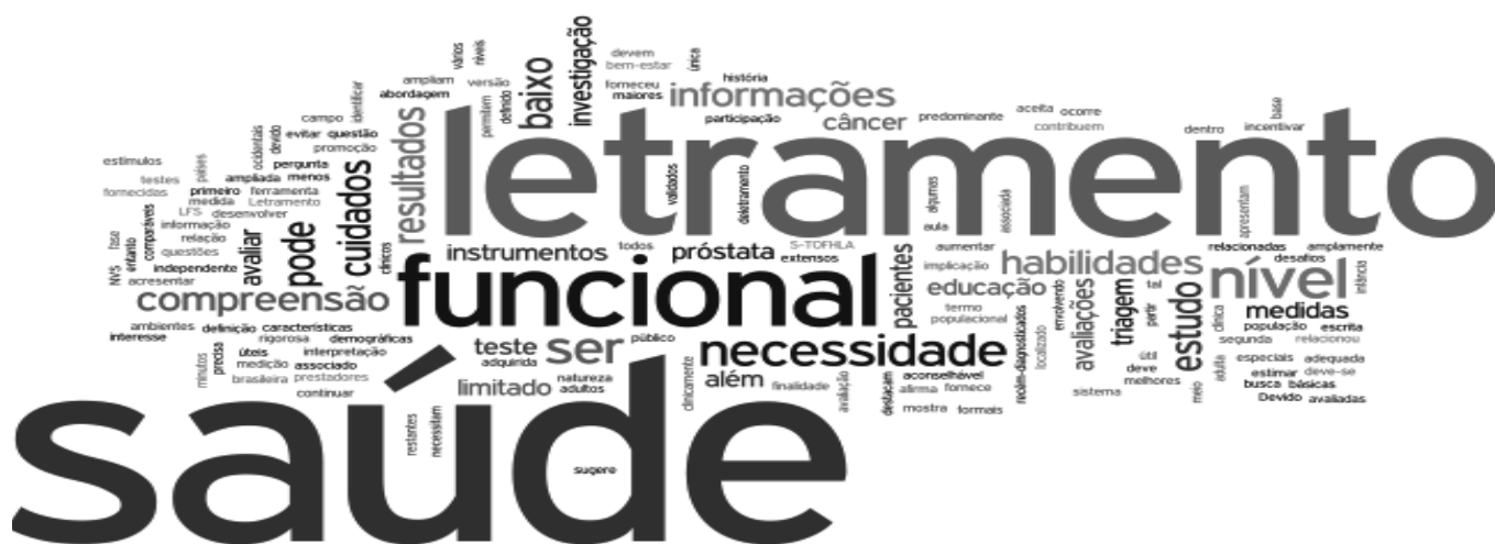
Figura 6. Nuvem de textos gerada com base nas conclusões dos artigos utilizados na revisão de literatura