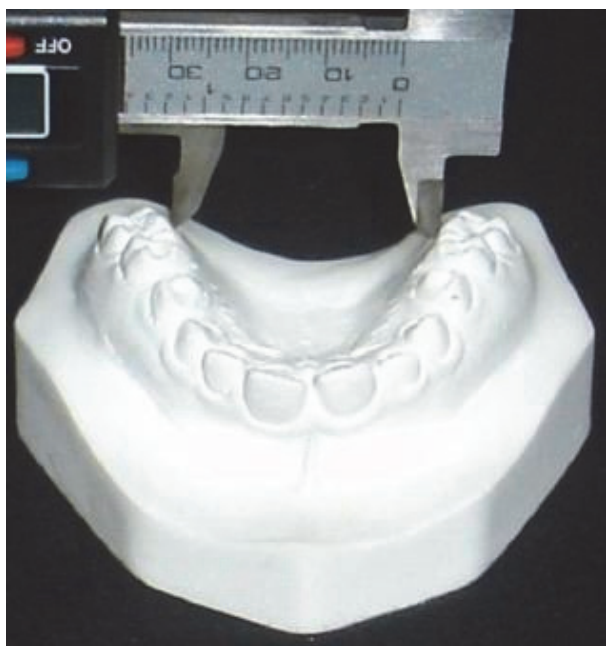
Figura 1 – Largura palatina

Para medição da largura palatina foram marcados pontos de referência nos modelos em gesso ao nível dos primeiros molares superiores, na região correspondente à união da borda gengival com o sulco palatino 20 . A largura palatina correspondeu à distância transversal em milímetros entre os pontos previamente estabelecidos (Figura 1).