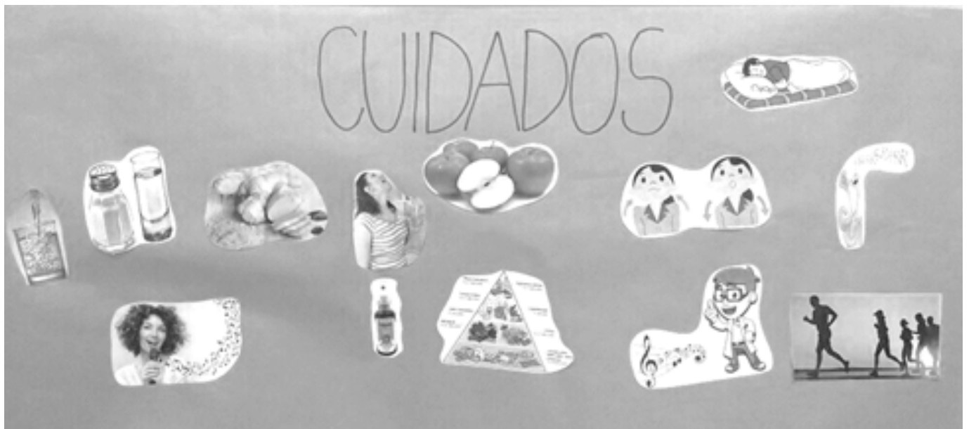
Figura 3. Codificação e descodificação do tema “Cuidados com a voz”, levantados pelos participantes durante os Círculos de Cultura

O último tema dialogado foram os “Cuidados com a voz” (Figura 3), em que os participantes trouxeram informações sobre mitos e verdades relacionadas à saúde vocal. Surgiram inúmeras considerações quanto à importância da respiração para o canto, à realização de exercícios vocais, exercícios físicos, qualidade do sono, alimentação balanceada e ingestão de água, e outros como o consumo do gengibre, álcool, sprays e pastilhas.