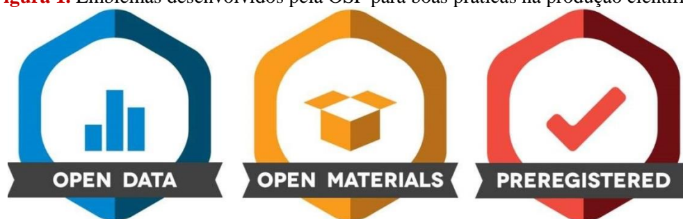
Figura 1. Emblemas desenvolvidos pela OSF para boas práticas na produção científica.