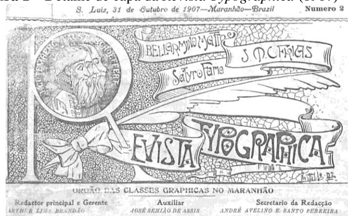
Figura 1 – Detalhe de capa da Revista Typographica (1907)