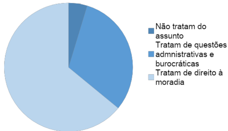
Gráfico 1. Legislação federal brasileira entre 1996 e 2016

Dentre as 41 normas que tratam do direito à moradia, 34 refletem diretrizes da Declaração de Istambul (conforme Gráfico 2), ainda que sem referência expressa na exposição de motivos. O impacto da Habitat II na legislação brasileira foi mais evidente, com a inclusão da moradia no rol dos direitos sociais previstos na Constituição federal, com a criação do Estatuto da Cidade, que em sua exposição de motivos fez referência direta à Conferência, e com a criação do Programa Minha Casa, Minha Vida, que é a política habitacional brasileira de maior impacto, porém ainda insuficiente, na promoção do direito à moradia.