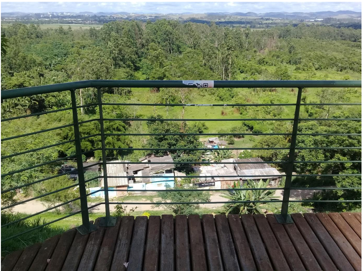
Ver e não olhar

Por último, compreendemos que a naturalização dessas contradições se expande também para as formas de tecnologias eletrônicas, na oposição entre olhar, e não ver e ver, e não olhar, porque perdemos a experiência do ver em detrimento do olhar e, portanto, ocorre a separação entre quando estamos vendo algo, mas não conseguimos olhar devido à própria naturalização da imagem à nossa frente, e quando olhamos, mas não se torna possível ver em decorrência da imagem que se encontra traduzida pelo viés das tecnologias eletrônicas.