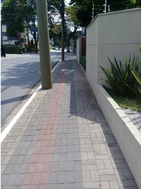
Lugar para andar

Ao analisar o lugar para andar e lugar para não andar, compreendemos como existe o lugar que permite conduzir os nossos corpos pelos espaços urbanos e outros lugares que se apresentam interditados e se naturalizam como lugar para não andar.