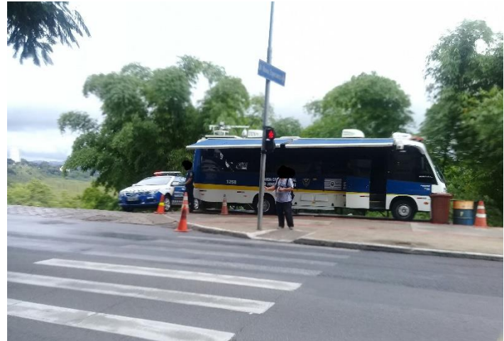
Lugar para não andar (Foto do autor 02)

O lugar para andar na cidade seria o delineamento feito pelas calçadas que traça e determina as linhas por onde o corpo do sujeito pode se deslocar no espaço urbano (Foto do autor 01).