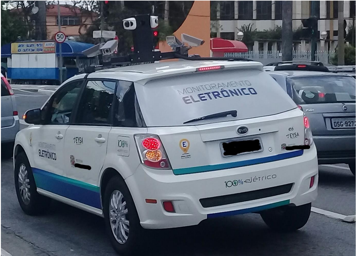
Olhar e não ver (Foto do autor 06)

Compreendemos que o ver esteja relacionado como uma estrutura biológica do sujeito no sentido de constituir uma determinada representação de imagem, enquanto o olhar está relacionado com os aspectos da cultura em que o sujeito pode elaborar o pensamento no entorno da imagem como elemento de determinada representação no conjunto de narrativas que se produzem sobre a realidade.