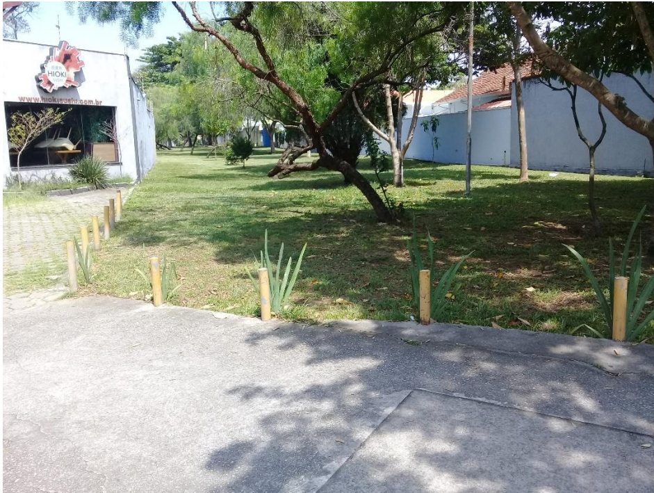
Rua aberta

Essas formas de ruptura analisadas nos permitem avançar para outros desdobramentos, de forma que as interdições se polarizam entre a rua aberta e a rua fechada. Fica estabelecido pelo senso comum que existem espaços específicos para os sujeitos se deslocarem, alguns são apropriados como espaço privado e outros, públicos, encontram-se desprovidos de ocupação.