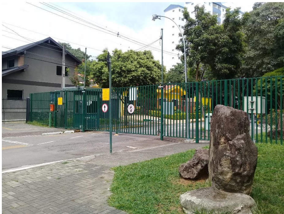
Rua fechada