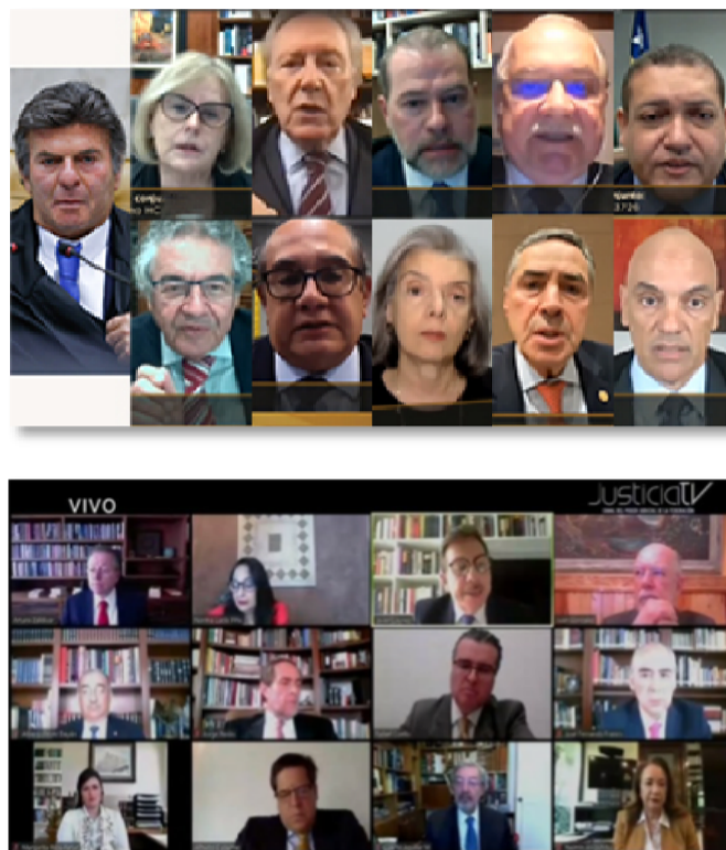
FIGURA 3 – SESSÃO POR VIDEOCONFERÊNCIA: BRASIL E MÉXICO