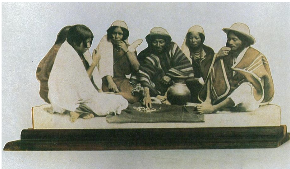
Figura 9 – Fotografia desconhecida, Una comida familiar , Pichincha, ca. (1900)

Nos retratos de família ocidentais, os corpos são organizados na cena fotográfica de acordo com sua altura, de modo a produzir um equilíbrio na imagem. Todos os rostos devem estar claramente expostos, para permitir a identificação. Os personagens do centro são os mais importantes (pais, avós), a partir dos quais são organizados os demais membros da família (BOURDIEU, 1990: 22). Para os índios, contudo, a lógica é outra: a fotografia precisa explorar a desordem, o paganismo, a irracionalidade e o exótico (Figura 9).