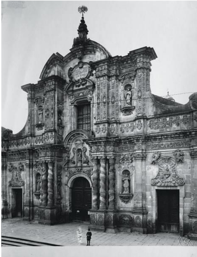
Figura 4 – José Domingo Laso Acosta, Igreja da Companhia de Jesus (1911)

mas livre da presença indígena. Livre da presença indígena que era necessária para a realização dos trabalhos semiquualificados, mas ao mesmo tempo indesejada para a imagem moderna da cidade.