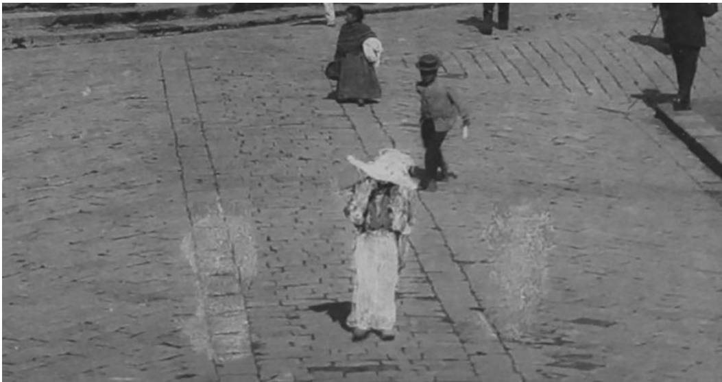
Figura 2 – José Domingo Laso Acosta, detalhe de Catedral e Praça da Independência (1911). Cortesia do Arquivo Histórico do Ministério da Cultura do Equador

Discriminação visual? Higienização? Um retoque fotográfico moral? Racismo? Mais do que um catálogo de imagens urbanas de Quito, essa série de Laso é uma atitude política, uma forma de produção de sentido cuidadosamente elaborada, de modo a produzir uma versão imagética específica. Através de intervenções tanto nos negativos, quanto nas pranchas de impressão das fotográficas 1 , Laso apagou a presença indígena das suas fotografias de Quito ou desenhou, de modo sobreposto aos negativos ou às pranchas, vestidos e outras roupas europeias sobre os corpos indígenas, para esconder-lhes a identidade étnica.