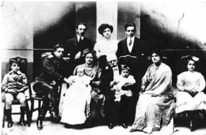
Figura 8 – Benjamín Rivadeneira, El General Eloy Alfaro con su familia , Quito (1910)

Há nas fotografias dos índios da América Latina uma oposição implícita entre natureza e cultura, ou civilização e barbárie. Oposições entre superioridade cultural hispânica e natureza selvagem dos ameríndios. As imagens indígenas parecem tematizar a diferença entre racionalização e disciplina, de um lado, e selvageria e barbárie, do outro (LASO CHENUT, 2017: 25).