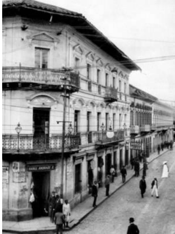
Figura 3 – José Domingo Laso Acosta, Rua Guayaquil (1911) Cortesia do Arquivo Histórico do Ministério da Cultura do Equador

figura feminina europeia, vestida com chapéu e uma roupa fantasmagoricamente branca, como se quisesse anular qualquer resquício da presença indígena na imagem da capital do Equador.