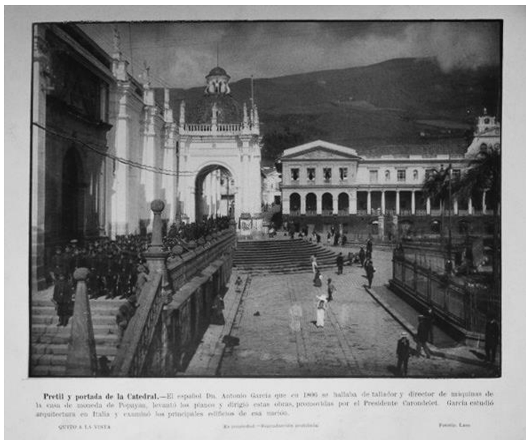
Figura 1 – José Domingo Laso Acosta, Catedral e Praça da Independência (1911).