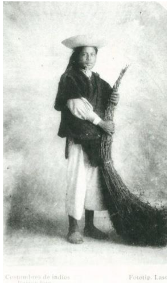
Figura 10 – José Domingo Laso, Costumbres de indios: Barrendero , Quito (1900)

Na fotografia do barrendero de Laso (Figura 10), há uma aparente dignidade na relação entre a pose e o enquadramento fotográfico. A posição da câmera, montada na altura do peito do índio varredor de rua produz o efeito visual de colocar o olhar do observador na posição de um olhar infantil, como o de uma criança a contemplar a autoridade de um adulto. O índio varredor, desse modo, situa seu olhar um pouco de cima para baixo, denotando dignidade, equilíbrio e confiança. Mas por outro lado, o índio se encontra aprisionado em um cenário artificial, que opera a desconexão entre a imagem indígena e sua cultura, suas raízes e suas tradições.