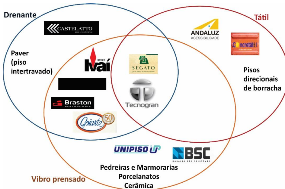
Figura 2 – Mapa de concorrentes por segmento

Os concorrentes diretos da Tecnogran em pisos de alto tráfego no Brasil (Figura 2) são: Unipiso (RJ), Goiarte (GO), Segato (MG), Ivaí Pisos (PR) e Basalto São Cristóvão (RS).