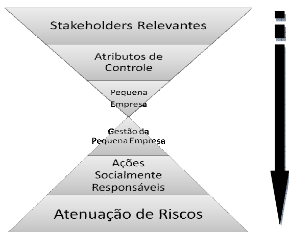
Figura 2: Modelo dos Impactos das Ações Socialmente Responsáveis

A Figura 2 procura mostrar que a tendência é as PME possuírem pouco ou nenhum poder de influência sobre as imposições e mudanças do macroambiente (CÊRA; ESCRIVÃO FILHO, 2003). Entretanto os aspectos positivos são que iniciativas como programas de inclusão e disseminação da RSE em rede modificam as relações sociais internas nas organizações, disseminam novos comportamentos e geram valor na forma de reputação positiva para as empresas que fazem parte desta rede.