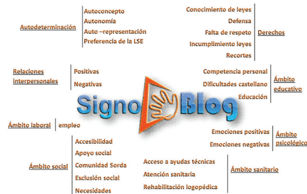
Figura 2 - Mapa conceptual

Recopilados los 51 signoposts, se determina que la unidad de análisis, esto es, la mínima fracción con significado, es la palabra (23) . Con el fin de garantizar el rigor metodológico se planifican dos tipos de pruebas de valoración interjueces: la primera, relativa a la interpretación en sí misma de los vídeos signados, se realiza con un intérprete de lengua de signos en activo, con una larga trayectoria profesional de más de 15 años, y con el propio administrador Sordo del sitio web. Finalmente no se recibe respuesta alguna de los dos expertos, por lo que se toma la decisión de eliminar siete videoposts que generan dudas en cuanto a su correcta interpretación, debido a que algunos están expresados en una lengua de signos catalana (LSC) muy pura, diferente de la LSE, y otros están grabados con una mala calidad. En el segundo tipo de prueba de interjueces se pide la intervención de profesores expertos en discapacidad del máster de Investigación en Discapacidad y del máster de Trastornos del Lenguaje y la Comunicación de la Universidad de Salamanca para validar el sistema de categorías extraído del discurso de los signoposts. A partir de las sugerencias de los expertos y con la utilización del programa informático NVIVO10, se estructura el mapa conceptual integrando unidades de información, metacategorías, categorías y subcategorías que sirve de base para el análisis de contenido (véase Figura 2).