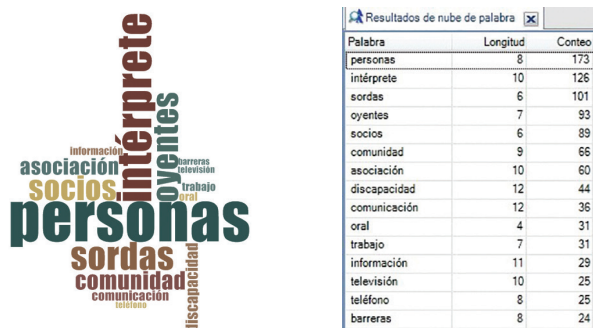
Figura 3 - Representación de las palabras más frecuentes del estudio

A través de un análisis semántico se encuentra que las palabras más repetidas en los vídeos analizados son las representadas en la Figura 3. Se aprecian dos bloques de palabras, el primero y más mencionado acapararía las palabras relacionadas con las personas y la comunidad, y un segundo bloque que hace referencia a la comunicación.