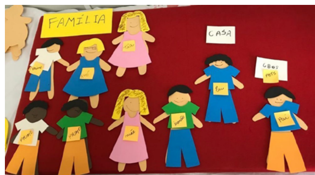
Figura 1 – Registro fotográfico de flanelógrafo montado ao término de entrevista com criança

Na entrevista com as crianças, utilizou-se como estratégia de aproximação uma história em quadrinhos sobre obesidade e um flanelógrafo (quadro recoberto com feltro, sobre o qual ilustrações e letreiros podem ser colocados, retirados ou deslocados de sua posição inicial (Figura 1)), no qual as crianças identificavam a família e sua rotina diária e alimentar. Também foi utilizado um roteiro estruturado, para coletar os dados sociodemográficos dos participantes, que foi respondido pelos familiares.