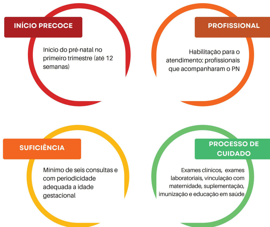
Figura 2 – Critérios para avaliação do pré-natal segundo as dimensões propostas por Heredia-Pi et al. (12) .