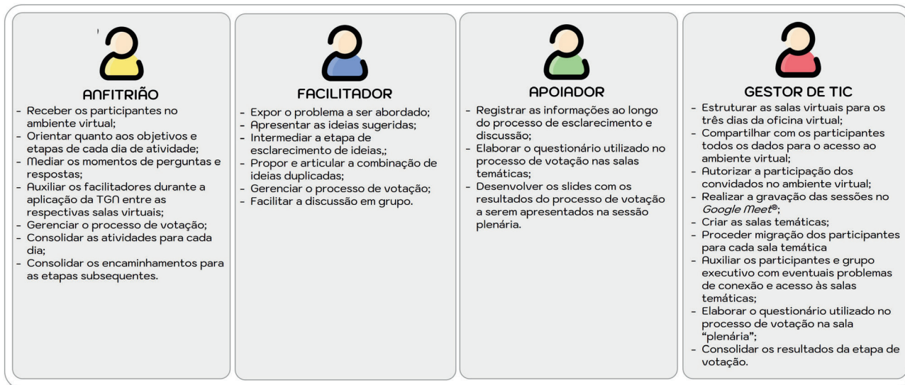
Figura 1 – Papéis do time executivo durante a Técnica de Grupo Nominal, São Paulo, SP, 2022.